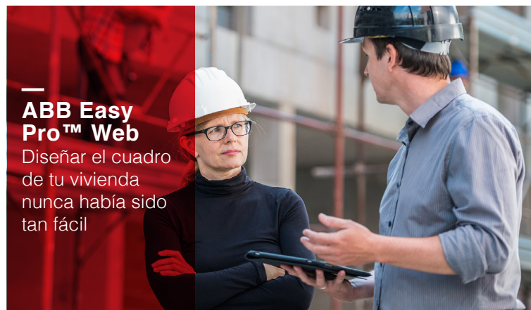
ABB Easy Pro™ Web

Diseñar el cuadro de tu vivienda nunca había sido tan fácil